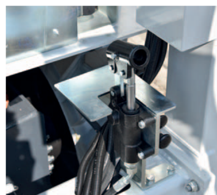
Dispositivo manuale di rientro degli stabilizzatori