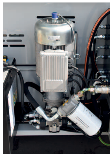
Motore elettrico AC