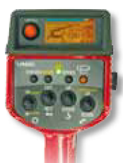
Radiocomando opzionale con visualizzazione digitale