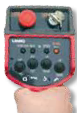
Radiocomando di serie